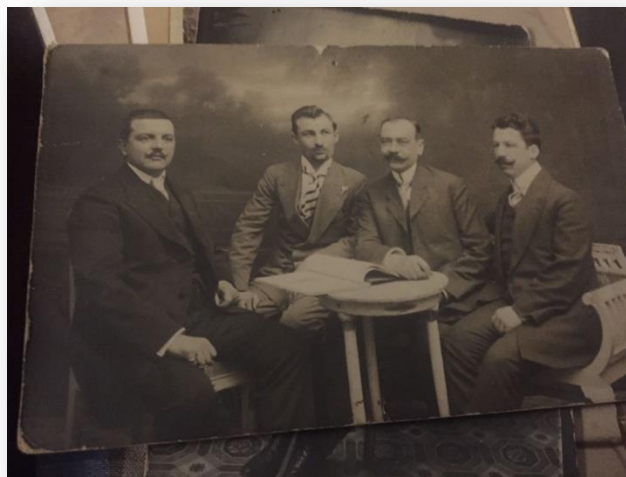
Patina vremii (carton și emulsie)

În ceea ce privește calitatea fotografiei , este evident că poza originală a suferit în mod vizibil o degradare firească, cauzată de trecerea anilor, manifestată în special asupra emulsiei , dar și a suportului . Patina vremii și-a spus cuvântul, ceea ce conduce la confirmarea autenticității sale, nefiind o copie sau contrafacere. Totuși contrastul acesteia este de bună calitate, încât personajele sunt bine conturate în fotografie.